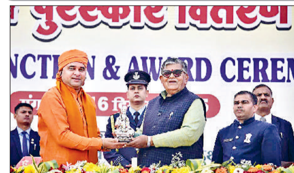
रोहतक। आयोजित कार्यक्रम में मुख्यअतिथि पंजाब के राज्यपाल गुलाबचंद कटारिया को स्मृति चिन्ह देते महंत बालक नाथ योगी।

देशभक्ति, भारतीय संस्कृति, सामाजिक समरसता, नैतिक मूल्यों और मानवीय संवेदनाओं पर आधारित नृत्य, गीत और नाट्य प्रस्तुतियों ने दर्शकों को भावविभोर किया, समारोह के दौरान शैक्षणिक, खेलकूद एवं सह-पाठ्य गतिविधियों में उत्कृष्ट प्रदर्शन करने वाले छात्रों को किया सम्मानित