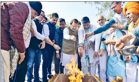
महम। पेराई सत्र के मौके पर आयोजित हवन में आहुति डालते सहकारिता मंत्री व मिल प्रबंधन समिति सदस्य।

2 मंत्री ने गन्ने से भरी ट्रॉली को ट्रैक्टर से मिल तक पहुंचाया